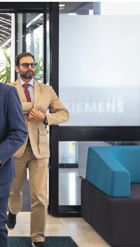
O secretário de Estado da Digitalização, Mário Campolargo, fez o encerramento do evento.

não está a ser desenhado na melhor orientação. “O Parlamento Europeu fez um disparate. Não tenho grande esperança. Veio exigir aos fornecedores destes sistemas que fizessem um resumo detalhado das obras protegidas por direitos de autor”, lamentou sobre aquilo que considera uma “regra impossível de cumprir”.